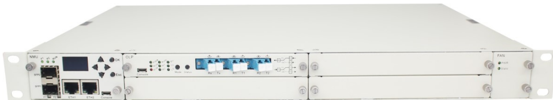
支持 1 路主备光纤切换(最大支持 4 路)