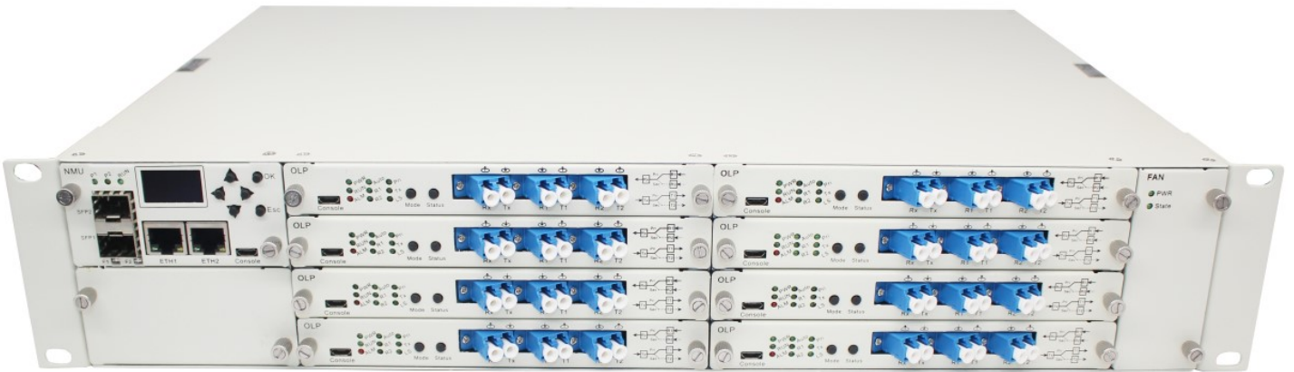
支持 8 路主备光纤切换